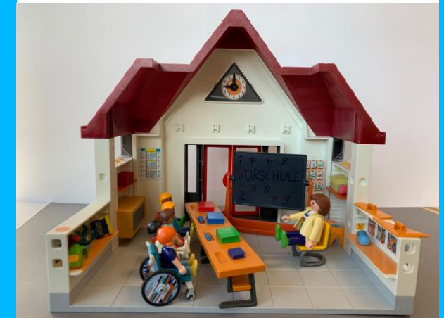
Eine Einrichtung zwischen Kita und Grundschule